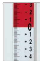
Plus-Minus-Skala mit mm-Teilung