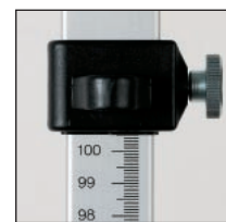
Millimeterskala für die Höhenmessung